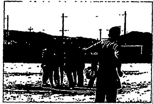
マウンドに集まる愛知県内野手