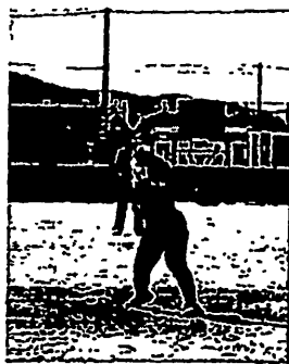
完封勝利の埼玉県増田投手